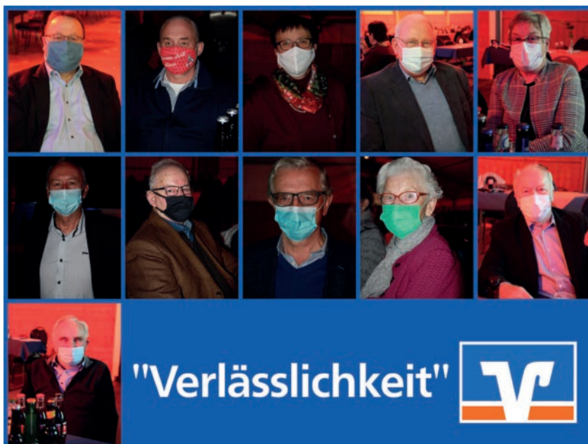
Die geehrten Jubilare auf der Generalversammlung 2020